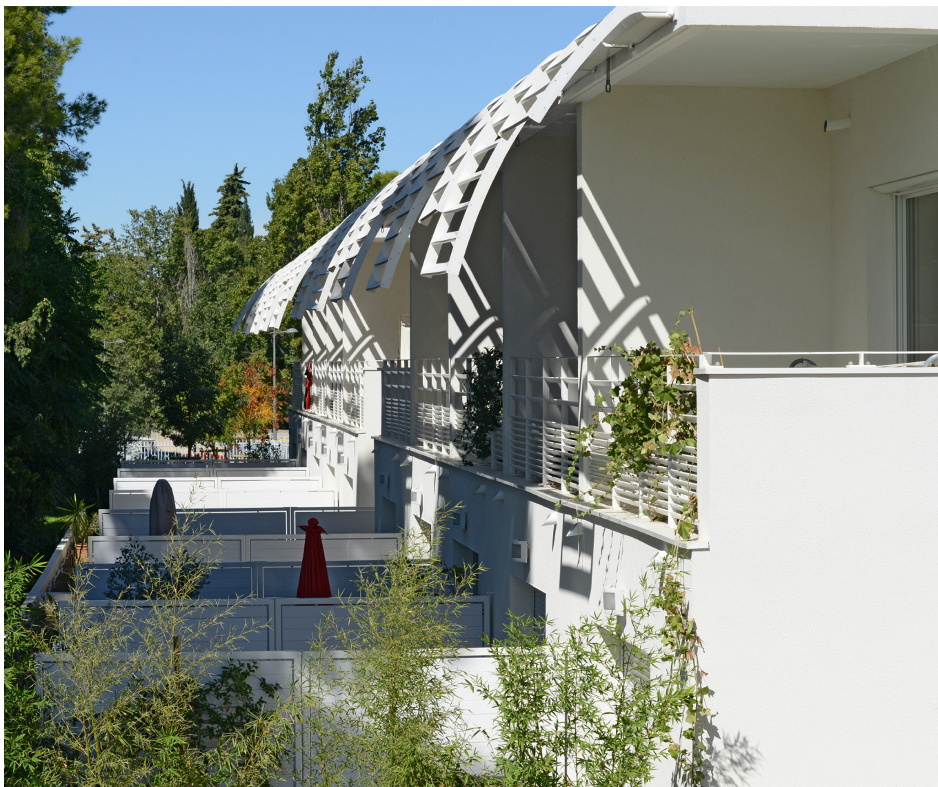
Immeuble de logements – Green Village à Montpellier

Par ailleurs, nous avons investi, pour le compte des deux SCPI Scellier, dans 12 programmes immobiliers dont 7 programmes pour Allianz DomiDurable 2 dont le patrimoine n'est pas encore totalement constitué. Ils sont principalement situés en région parisienne où la profondeur de marché reste la plus importante.