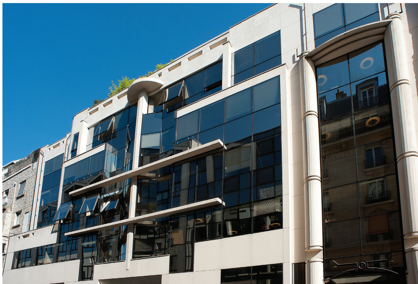
Immeuble de bureaux – 2-2 bis, Villa Thoreton – Paris 15 ème

La situation sur le marché locatif de bureaux est, quant à elle, marquée par un fort ralentissement qui se caractérise par un repli de l'ordre de 25 % pour l'Île-de-France. L'une des caractéristiques actuelles de ce marché est la recherche par les bailleurs et les locataires d'une plus grande sécurité qui conduit à des renégociations de baux dans la perspective de pérenniser les occupations d'immeubles et de renégocier des baisses de loyers. Dans ce contexte, nous restons concentrés sur l'activité de relocation du patrimoine de votre SCPI Allianz Pierre qui a été très importante : l'année se soldant par plus de 55 relocations pour une surface totale de 25 000 m 2 .